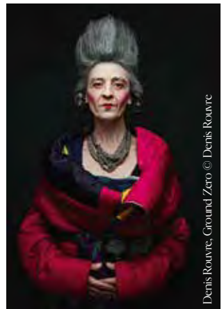
Denis Rouvre, Ground Zero © Denis Rouvre